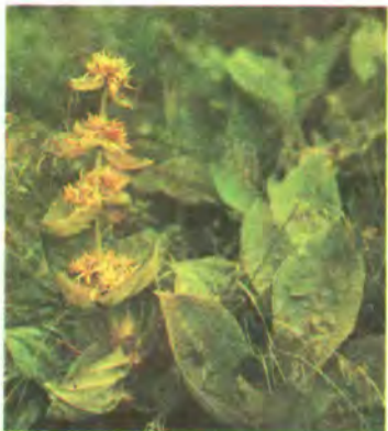
511. Тирлич жовтий